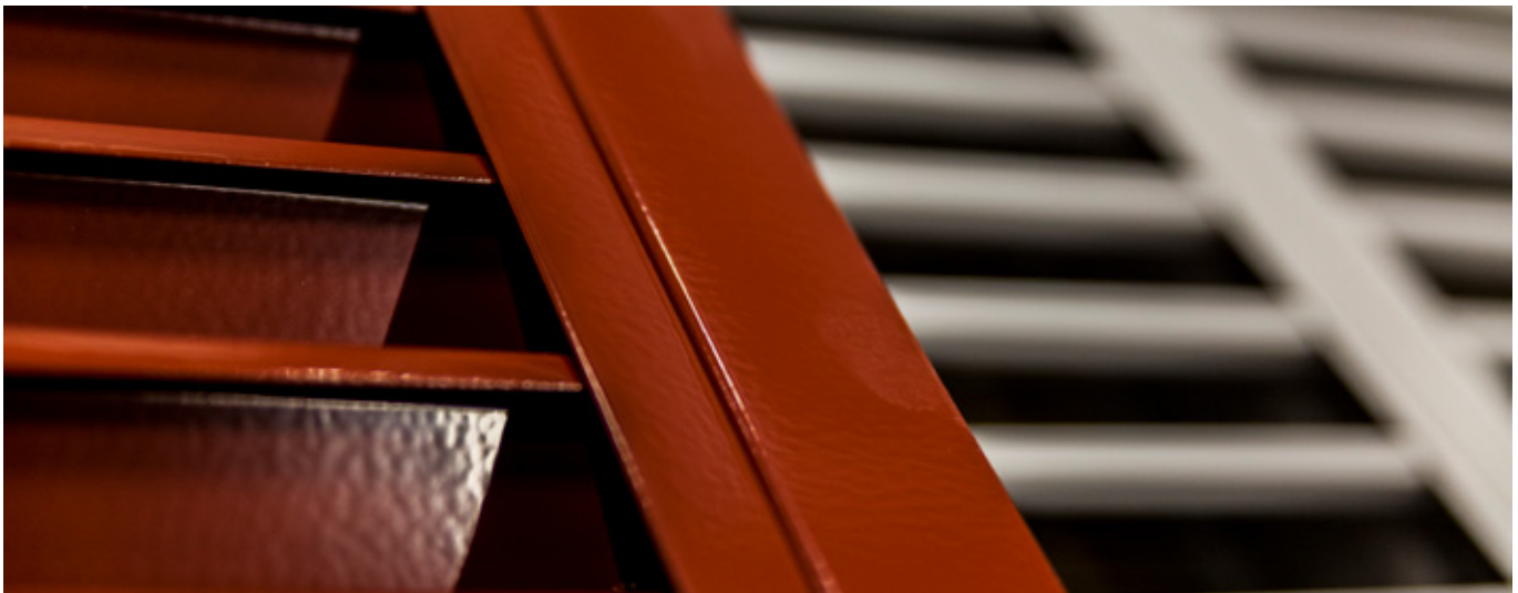
Ytterväggsgaller som nyligen pulverlackerats i korrosivitetsklass C4 och härdats i vår värmeugn.